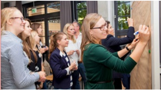
Teilnehmerinnen des Careerbuilding-Programms der Femtec