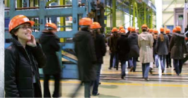
Auf Exkursion – Werksbesichtigung bei der ThyssenKrupp AG

Sie studieren Ingenieur- oder Naturwissenschaften? Sie sind in Ihrem Studium erfolgreich und wollen Ihre Karriere aktiv gestalten?