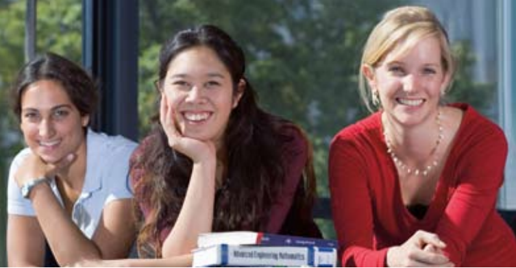
Teilnehmerinnen des Careerbuilding-Programms der Femtec