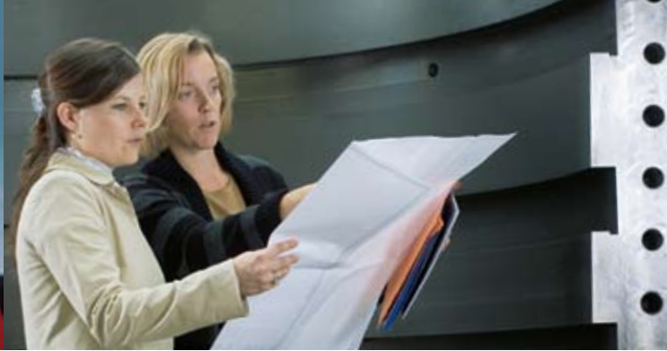
Von Vorbildern lernen – Ingenieurinnen der Siemens AG