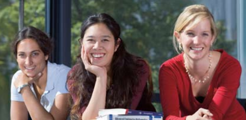
Femtec-Studentinnen an der TU Berlin