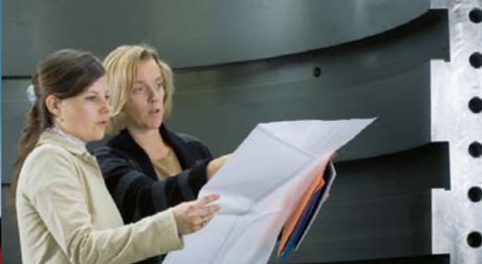
Ingenieurinnen der Siemens AG