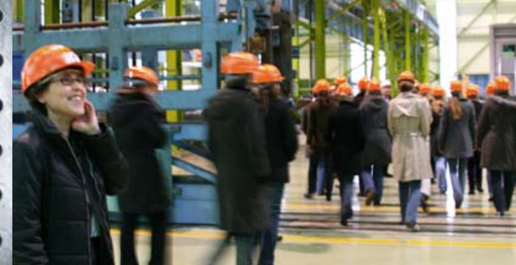
Ein Femtec-Kurs auf Exkursion

Sie studieren Ingenieur- oder Naturwissenschaften? Sie sind in Ihrem Studium erfolgreich?